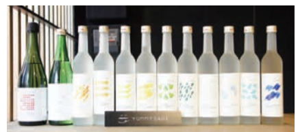
オリジナル日本酒「オノマトペ酒」 HP: https://yummysake.jp/