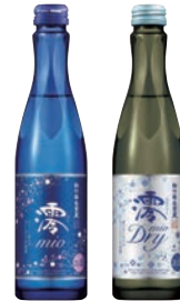
『松竹梅白壁蔵「霽」スパークリング清酒 / 「霽」〈DRY〉スパークリング清酒 150ml/300ml/750ml』／宝酒造

酒販店のKURANDとシンガーのBoAが共同制作した純米大吟醸が新発売。スリムタイプのワインびんでは珍しい茶色と和紙ラベルの組み合わせが目を引きます。